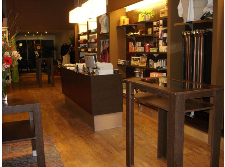
Arquitectura Comercial: Johan. Bahía Blanca.