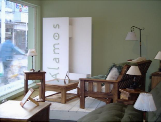
Arquitectura Comercial.: Alamos .Tandil